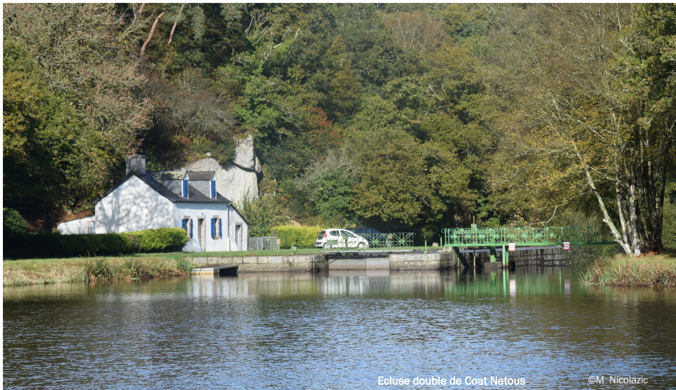
Ecluse double de Coat Natous