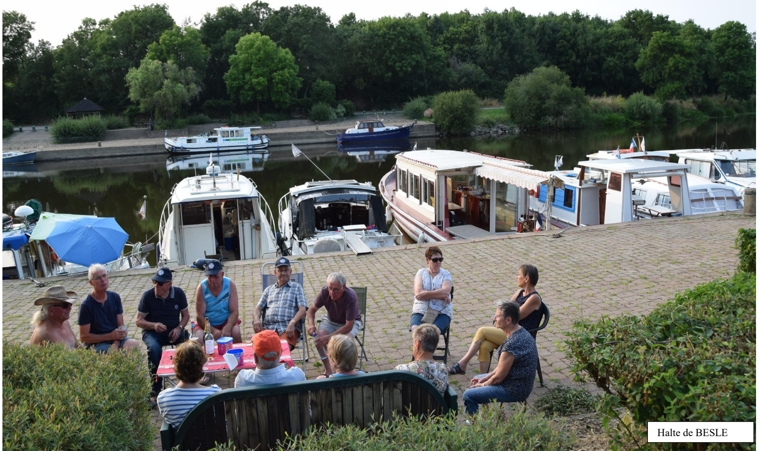
Halte de BESLE