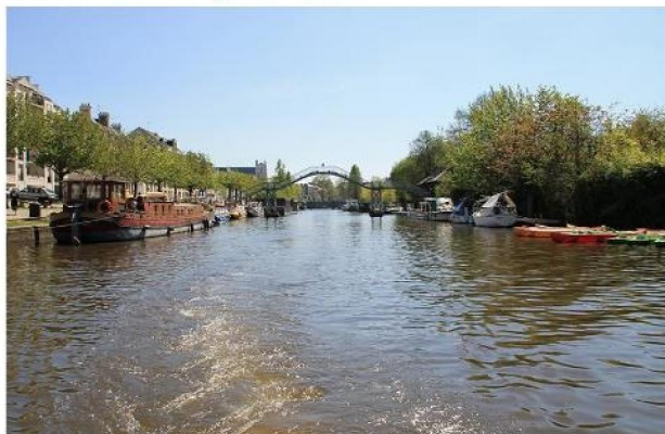
L'Erdre à Nantes